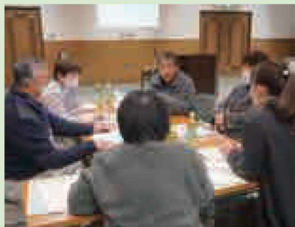
▲ 議題解決のための話し合い

「広陵ささえ愛」は、地域の高齢者のお困りごと（生活支援）や見守りなどを地域で支える活動を考え、進めています。「自分が支える地域は、自分を支えてくれる地域」となるよう小学校区ごとにワークショップやアンケート調査をしています。地域の支え合い活動に興味がある人は、広陵町社会福祉協議会にご連絡ください。