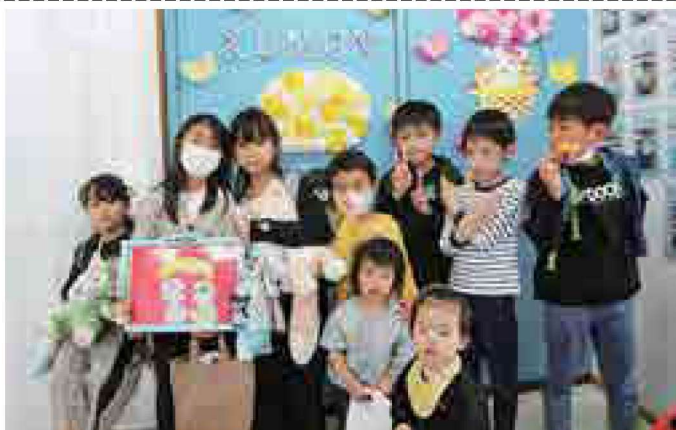
▲楽しく学ぶことができました！