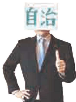
自治さん 自治基本条例に 詳しい妖精