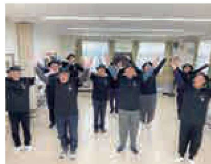
▲ 通いの場での体操

私達は、町主催の広陵町介護予防リーダー養成講座を修了した後、「KEEPの会」として町の介護予防普及啓発のために活動しています。主に、「通いの場」（地域住民主体で開催される運動を中心とした居場所）の立ち上げや継続支援をしています。運動だけでなく、「通いの場」の参加者が楽しく過ごせ、地域でつながりができることを目指しています。