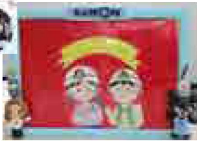
▲手作りの防災かみしばい

春の訪れが感じられる3月16日、大字萱野にあるKUMON広陵北教室で教室に通っている子どもたちへの防災教室が開かれました。