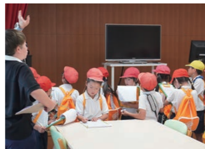
広陵東小学校3年2組

町内の小学3年生がさわやかホールの見学に訪れました。今回撮影させてもらったのは、5月21日に見学の真美ヶ丘第一小学校3年1組・2組と6月3日に見学の広陵東小学校3年1組・2組の皆さんです。 今回の見学では会議室やさわやかホール3階の老人福祉センターの茶室や大広間など、普段あまり入る機会のない場所を巡りました。 各施設では職員が説明を行い、児童はその話を真剣に聞いてメモを取ったり、積極的に質問したりする姿が見られました。特に茶室や老人福祉センターなどに普段あまり馴染みのない場所では一つひとつの話を聞いて新しい発見を楽しむ様子が印象的でした。