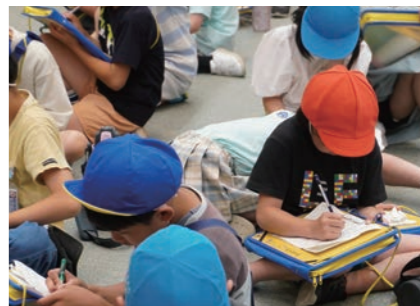
真美ヶ丘第一小学校3年1組