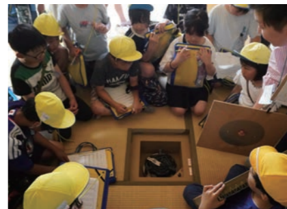
真美ヶ丘第一小学校3年2組