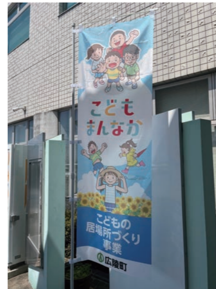
この旗があるところに「こどもの居場所」があります。

町では、子どもたちが家や学校以外でも安心して過ごせる「第3の居場所」づくりに取り組んでいます。昨年度に引き続き、今年度も夏休み期間中に無料で利用できる居場所を開設します。自習、読書、おしゃべりなど、自分らしく過ごせる快適な空間を利用してみませんか？