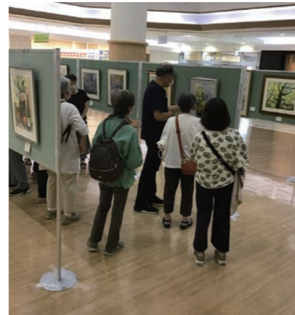
▲ 昨年の作品展の様子