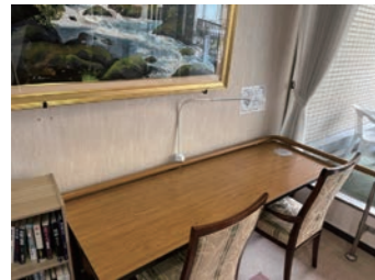
自習できる机もあります。場所：エリシオン真美ヶ丘