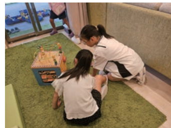
ゆったりとした空間で、のびのびと過ごすことができます。