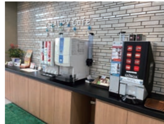
ドリンクバーも無料で利用できます。場所：奈良トヨペット広陵店