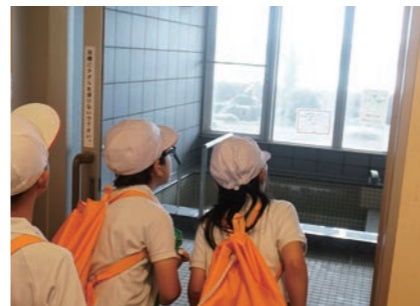
広陵東小学校3年1組