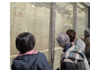
前回の見学会の様子