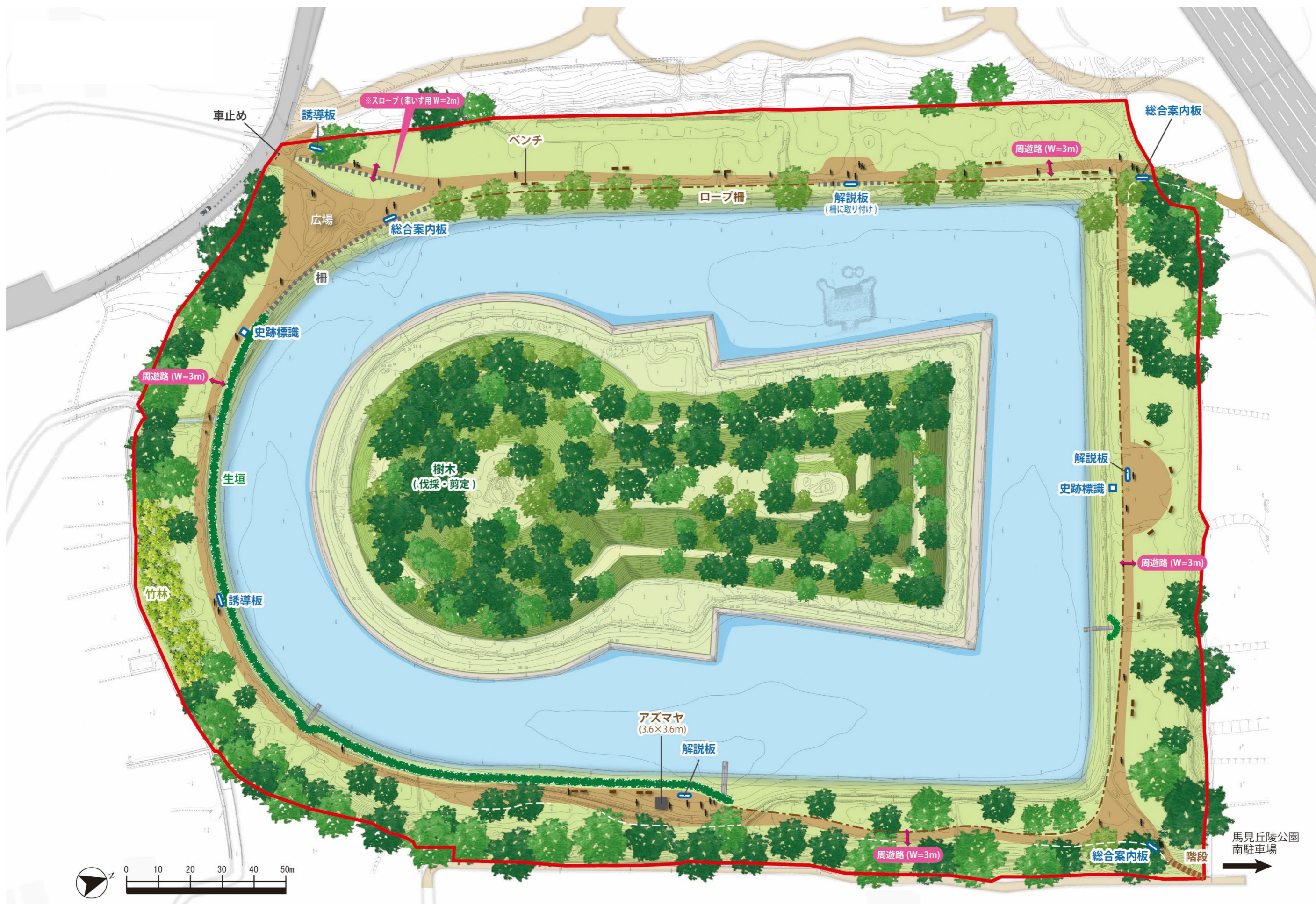
図 5-16 整備計画平面図