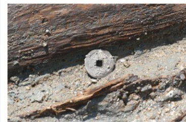
寛永通宝出土状況