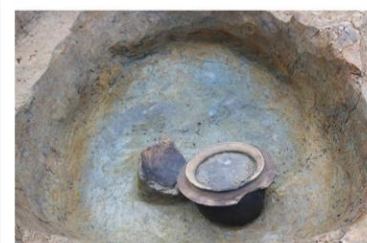
土坑171土器出土状況