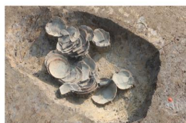
土坑内土師器出土状況