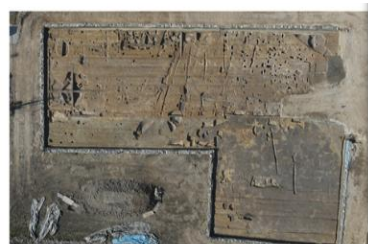
調査区全景 (右が北)

調査期間 : 令和7年11月27日から令和8年2月20日まで 調査場所 : 広陵町大字大野地内 調査面積 : 1407㎡ 遺構の概要 : 溝、井戸、土坑、柱穴など、奈良～平安時代が中心?の遺構を確認。遺跡範囲は北に広がる。 遺物の概要 : 土師器、須恵器、黒色土器、瓦器、瓦質土器、瓦、木製品など遺物箱65箱