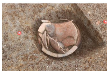
土坑300土器出土状況