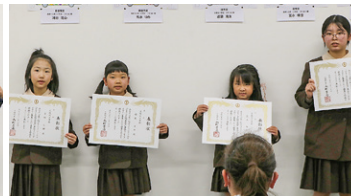
▲ 佳作 広陵北小学校受賞者