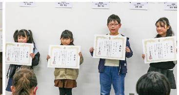
▲ 佳作 真美ヶ丘第二小学校 受賞者