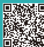
国税庁 ホームページ