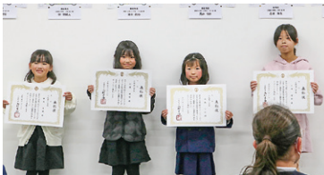
▲ 佳作 広陵西小学校受賞者