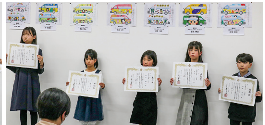
▲ 佳作 真美ヶ丘第一小学校受賞者