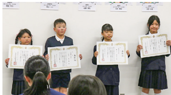
▲ 佳作 広陵東小学校受賞者