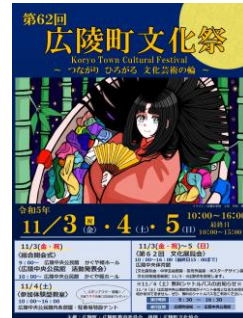
▲昨年度のポスター

※若年層の文化祭への参加を促すため、今年度も中学生(全学年から希望制)を対象にポスター原画を募集