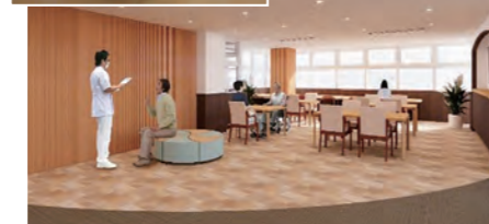
▲ 地域包括ケア病棟

治療法は、検査結果で骨量減少の程度から、判断・決定します。内服薬から開始することがほとんどで、その他、注射製剤も効果があります。適度な運動、日光浴なども骨筋肉の強化、ビタミン D の活性化などにつながるため必要となります。転倒リスクの高い方では、2、3 週間のリハビリ入院で運動機能チェックと骨粗しょう症の程度の診断などを行うことができます。令和 5 年 7 月からリニューアルオープンした、当院本館 6 階の地域包括ケア病棟で主に行っています。近々、骨粗しょう症・ロコモ外来を開設する予定です。まずは外来で骨粗しょう症の検査を行ってみることをお勧めいたします。