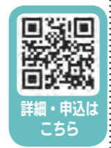
詳細・申込はこちら

▶ 場所： 上牧町保健福祉センター2000年会館(上牧町上牧3245-1) ▶ 申込・問い合わせ： (特非)空き家コンシェルジュ ☎0744(35)6211