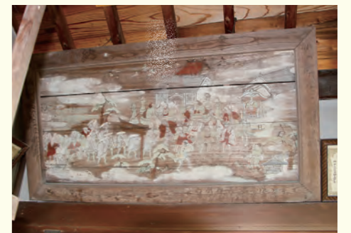
【最古級のだんじり絵】