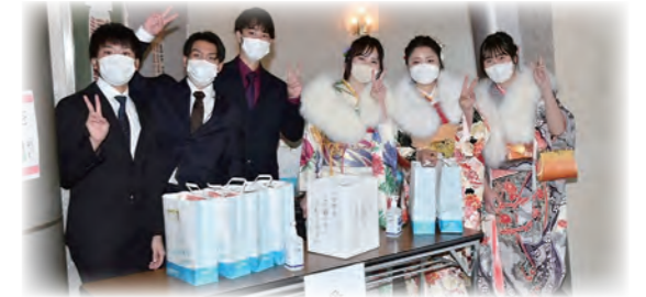
▲R4年度は、(株)南都銀行様に紙袋をご提供いただきました。

物品を基本としますが、飲食店で使用できる無料または割引チケット等も可とします。また、商品の性質上、サイズ選択が必要で、店舗での受け渡しが望ましい商品につきましては、引換券での納品も可とします。 ※広陵町が記念品として不適当であると認めるときはお受けできない場合があります。詳しくは町ホームページをご確認ください。