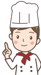
町内でお店を している人