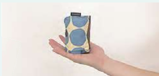
収納時は手のひらサイズ！

両端を“シュパッと”引っ張ることで一気に片手に収まるサイズにたたくことができ、レジかごにもかけられるコンパクトバッグ。 高さ 38cm × 横 50cm (使用時)