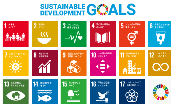
図表 SDGsに掲げられている17の目標

本町は、一般社団法人産業総合振興機構 (なりわい) の設立を通じて、商工業、農業、観光の分野について、地域の事業者、団体、個人の事業の立ち上げ、生産性の向上支援、マーケティングサポートなどの中間支援を行うとともに、機構自らの収益事業を展開し、地域経済への貢献を包括的に行うことなどを提案した結果、令和元 (2019) 年7月、SDGs推進に向けたポテンシャルの高い提案として、「SDGs未来都市」に選定されています。