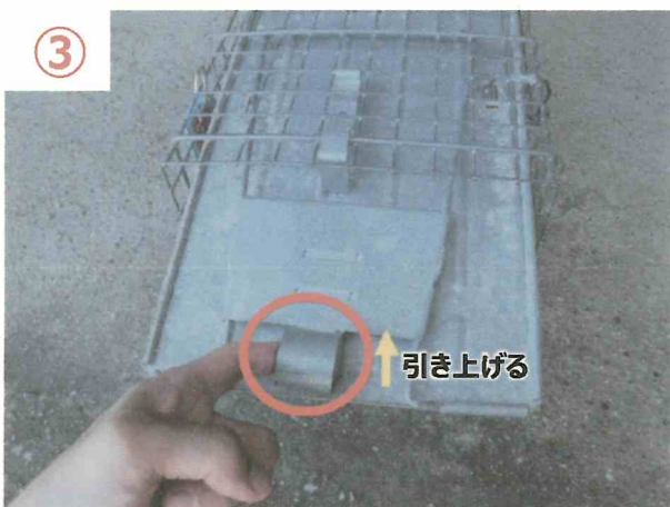
③ ②のバネを押し込んだ状態で、フタの輪っか部分をもち、上に引き上げる。