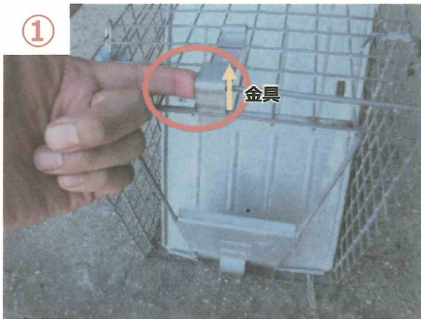
① 捕獲檻上部の金具を持ち上げる。