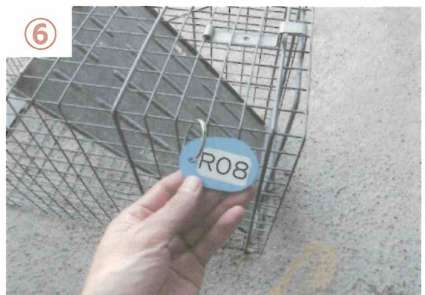
⑥ 返却時、捕獲檻の番号を係員に伝える。