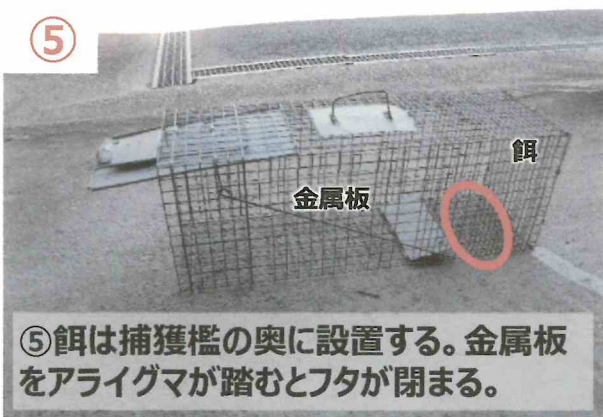
⑤ 餌は捕獲檻の奥に設置する。金属板をアライグマが踏むとフタが閉まる。