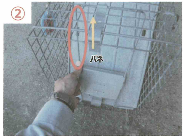
② フタについているバネを奥に押し込む。