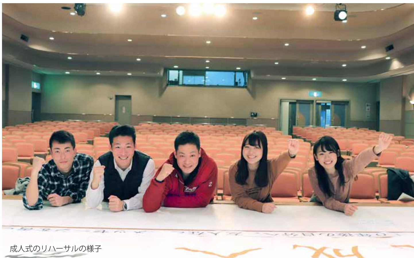
成人式のリハーサルの様子

1月14日、成人の日。多くの20歳にとって一生に一度の晴れ舞台です。そんな成人式を自分たちで最高の思い出にしようと集まった成人式実行委員会の方々の影なる支えを取材しました。