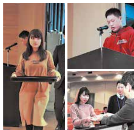
▲本番に備えてリハーサル

各々が1か月の成果を、出し切りました。当日は、大きなトラブルもなく、緊張も笑顔で吹き飛ばしているようでした。