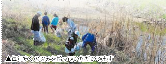
▲毎年多くのごみを拾っていただいています