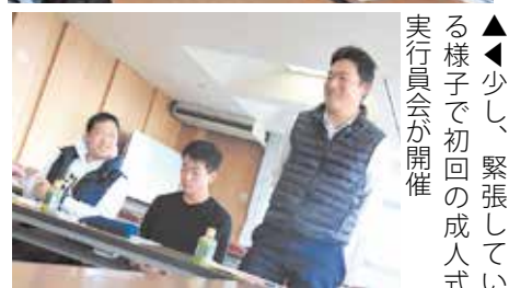
▲少し、緊張している様子で初回の成人式実行委員会が開催