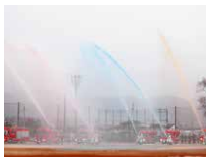
▲出初式の最後は、恒例の虹色の放水。迫力ある放水に会場は大いに盛り上がりました。