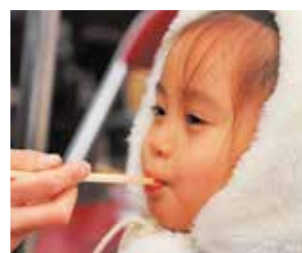
◀▲広陵町赤十字奉仕団の方々が参加者、観覧者に豚汁とワカメご飯を振る舞いました。