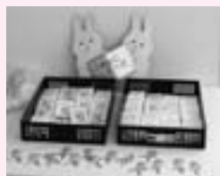
▲配布したオレンジリボン

9月22日、23日の2日間、かぐや姫まつりで、児童虐待防止のための「オレンジリボンキャンペーン」を行いました。