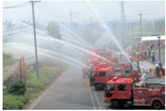
◀消防団による放水訓練