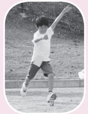
▲昨年の様子「けつとばすぞ～!」