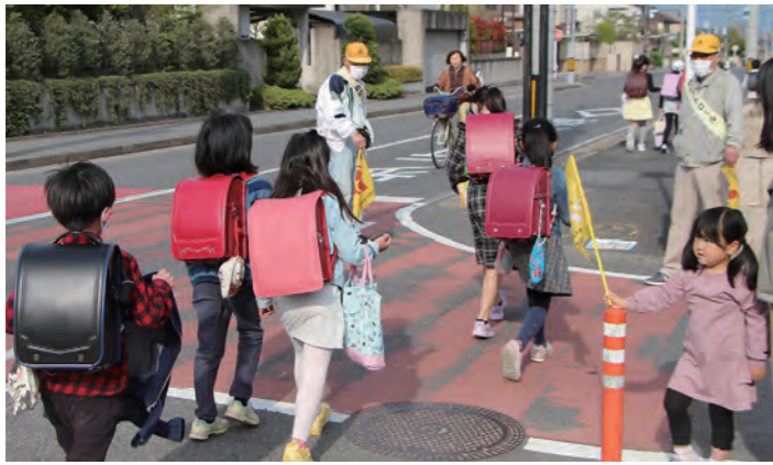
馬見北2丁目 「見守り（立哨）活動」