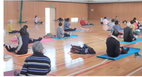
広陵元気塾の様子

「何よりも旅行に行けなくなったのが残念」とのこと。 「近所付き合いななど交流が減ってしまったのも