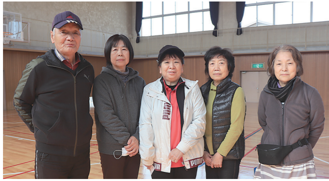
2月8日に開催された広陵元気塾に参加された方々