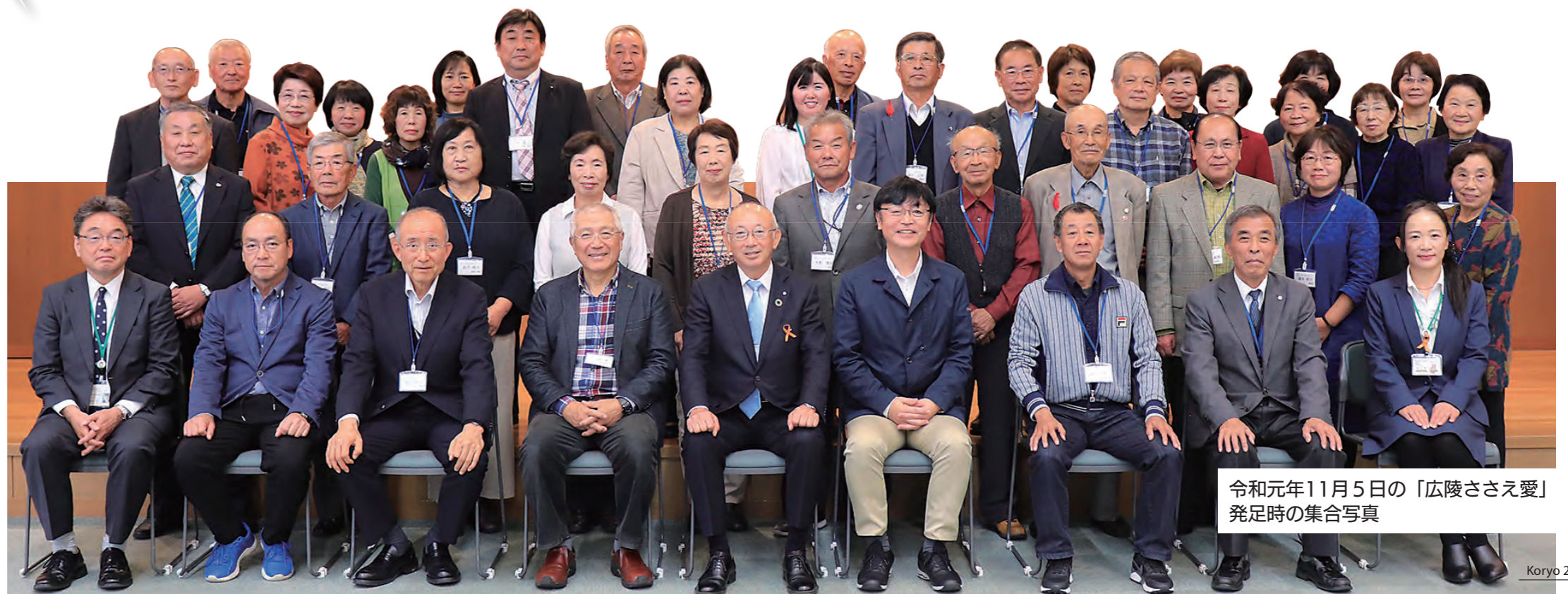
令和元年11月5日の「広陵ささえ愛」 発足時の集合写真