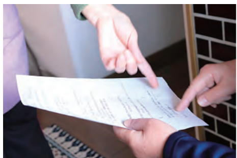
↑アンケートの記入方法を説明。この時に、困っていることを口頭でも聞きます。