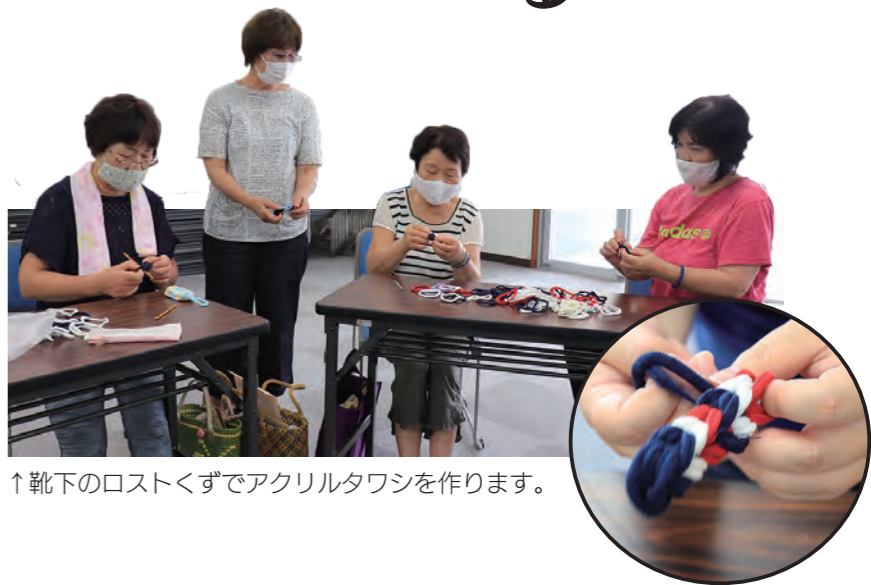
↑靴下のロストくずでアクリルタワシを作ります。