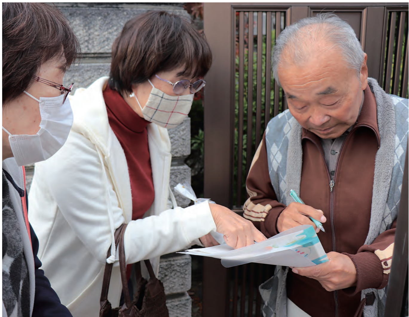
↑11月27日の「古寺きずな会」の参加呼びかけ訪問の様子。