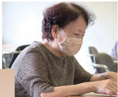
↓10月5日アンケート結果をもとに今後の取り組みを打ち合わせします。