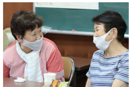
↑ 9月8日に開催された赤部のサロン。コロナ禍のなか対策をしながら、交流をしています。