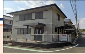
(馬見北6丁目集会所)