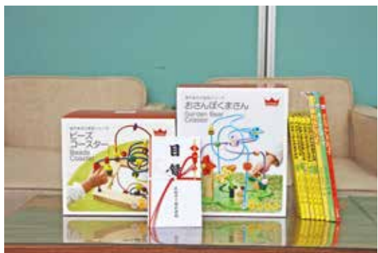
▲絵本と知育玩具が寄贈されました！

4月20日、「大阪ガスグループ小さな灯運動」より福祉行政推進のための物品（絵本、知育玩具）が寄贈されました。