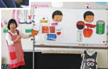
▲甘いお菓子は虫歯の原因