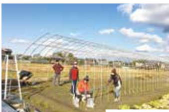
◀ビニールハウスの建設