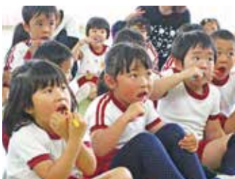
▲みんなできれいな 歯を守ろう