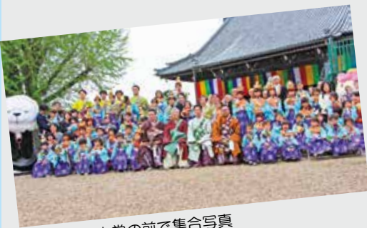
▲大きな本堂の前で集合写真

役場の開庁時間 午前8時30分~午後5時30分 ※土・日・祝日を除きます ホームページ http://www.town.koryo.nara.jp Eメール info@town.koryo.nara.jp