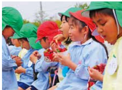
▲お友達と食べるイチゴは最高!