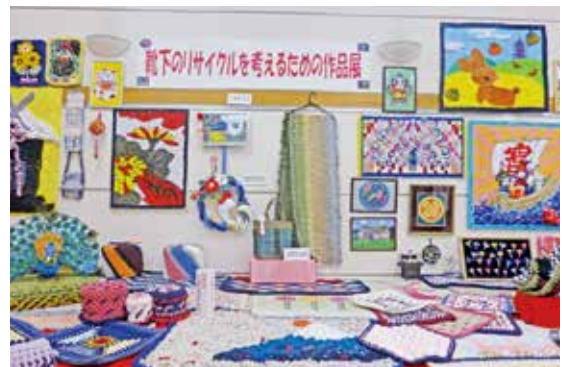
▲「靴下のロストくず」で作られた作品