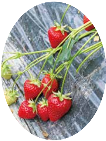
▲甘くて美味しいイチゴ