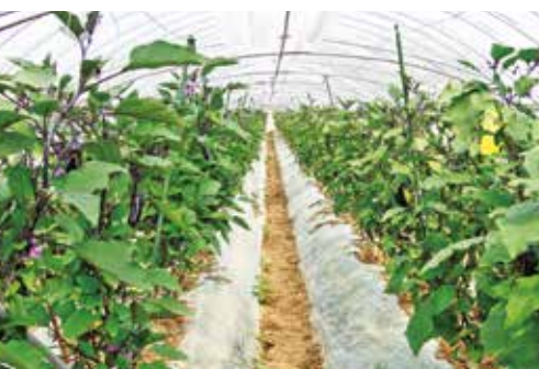
▲ナスは100mのハウス2棟で作られています