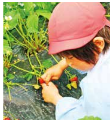
▲優しく採れました

役場の開庁時間 午前8時30分~午後5時30分 ※土・日・祝日を除きます ホームページ http://www.town.koryo.nara.jp Eメール info@town.koryo.nara.jp