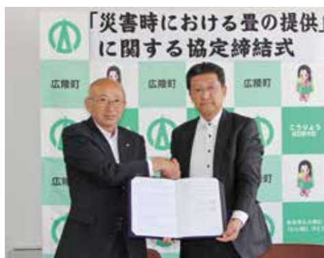
▲山村町長と武内近畿地区委員長

また同日、「5日で5000枚の約束」プロジェクト実行委員会と防災協定を締結しました。これは、大地震や風水害などにより避難所設営が必要となった際に、窮屈な避難所生活の中でもくつろげるよう、畳の支援を行っていたたくものです。全国では132の自治体が協定を結び、県内では4例目となります。町では、災害に強いまちづくりを多方面から推進します。