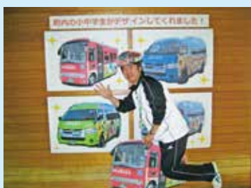
▲担当者が元気に元気号をPR！