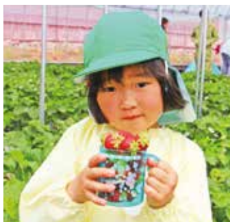
▲コップにいっぱい!