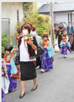
▲みんなで練り歩きました

今年、50年に一度の法要が行われるとともに、大きな行事がある際に催される稚児行列が行われました。約50人の子どもたち、またその保護者も参加し、教行寺までの善尾商店街は多くの人でにぎわいました。