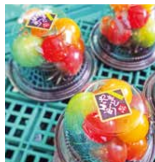
▲ミニトマトのパック詰め 赤・オレンジ・黄・緑・紫の5色

女性で、子育て中とのこと。西口さんのところで勤めて5〜10年になるそうです。農業はかなり大変そうでしたが、なぜここまで続けておられるのかを問うと、「ほかの働き口とちがって、子どもが熱を出したら休んだり早退できたりと、わりと融通をきかせてもらえる。」ことが大きいようです。夏場のビニールハウスは「サウナよりも暑い。」とのこと。過酷な環境ですね。「農作業は日々勉強。西口さんに求められることをこなさねばならないこともありますが、苦手だった野菜を食べられるようになったり、作物を育ていく様子をみたりするのは楽しい。」との思いを持ちながら、3人で仲良く協力し合い農作業をされているようです。