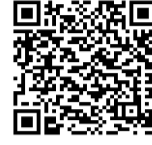
広陵町 教育委員会HP