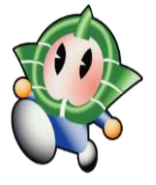
香芝市イメージキャラクター カッシー