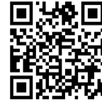
香芝市 教育委員会HP