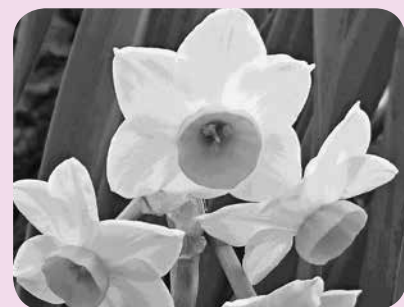
▲西方寺池(疋相地内)の水仙