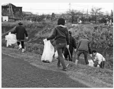
▲毎年多くのゴミを拾っていただいています