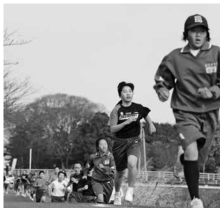
▲追いつかれないように……！