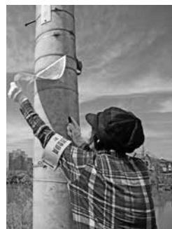
▲違反屋外広告物の除去