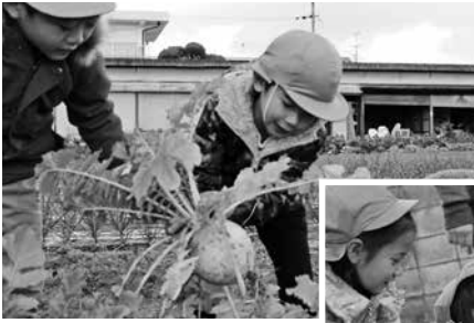
▲大きいのとれたよ！

取材させてもらった南保育園の子どもたちは、顔くらいある大根に苦労しながらも、収穫できると「先生とれた！」「持って帰って食べたい！」と大喜び！ 自分たちでとった大根はおいしかったかな？