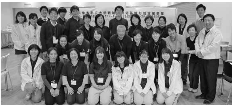
▲シニアキャンパス開催メンバー