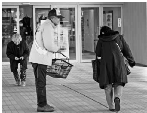
▲買い物客に啓発のティッシュを配布