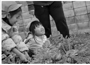
▲なかなか抜けないよ～