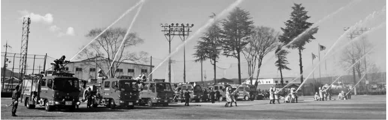
▲住民の財産や安全を火事から守るため、日々精進されています