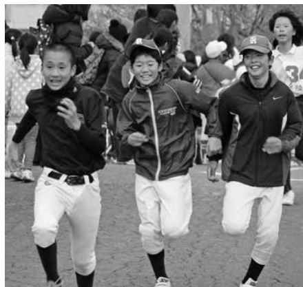
▲ゴール前のデッドヒート！