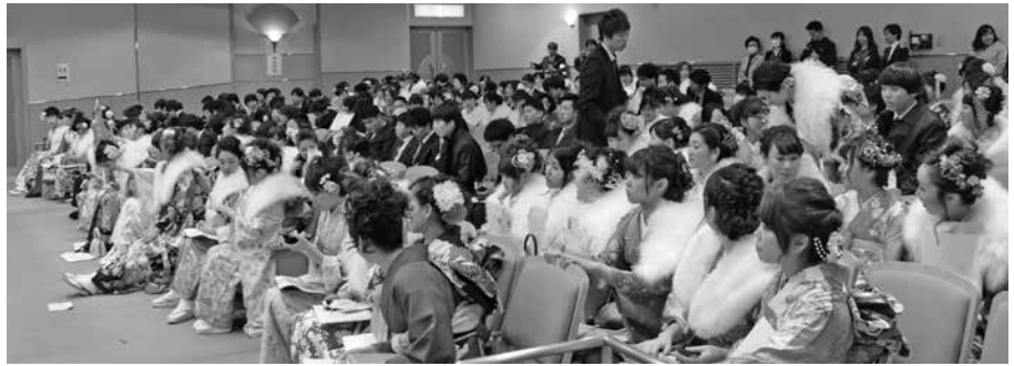
▲多くの新成人が出席しました

1月11日、広陵中央公民館かぐや姫ホールで、成人式が行われました。今年は町全体で、379人の新成人の皆さんが大人の仲間入りされました。