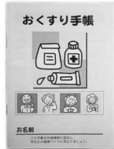
▲おくすり手帳の例

手帳は、院外処方せんをもらったら調剤薬局で作ってもらい、病院や医院、歯科医院、薬局に行った時は、毎回提出するようにしましょう。