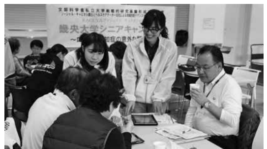
▲認知症を気軽に学ぶ

筋肉、骨、軟骨、椎間板などに障害が起こり、「立つ」「歩く」といった基本的動作が低下している状態のことです。