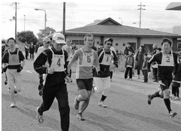
▲ミドル世代も頑張っています

皆さんも健康や体力づくりのためにジョギングやマラソンを行い寒さに負けない身体をつくりましょう。