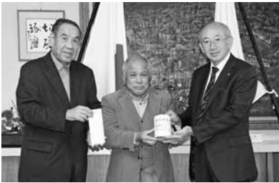
▲広銀会より町長へ手渡されました

いただきました募金は、すべて奈良県共同募金会へお届けし、配分金を受けて、ふれあい・いきいきサロン、歳末事業などの社会福祉事業に使わせていただきます。ご協力ありがとうございます。