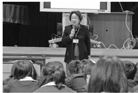
▲行政相談委員は、皆さんの行政についての困りごとについてしっかり相談をお受けします

1月14日、広陵西小学校で奈良行政評価事務所、町行政相談委員による出前授業が行われました。 出前授業を受けた6年生は、社会科で政治の勉強中。この日は、三権分立や行政の仕事について、また行政相談委員の仕事・相談について講義を受け、その後質問形式で学びました。 普段、聞き慣れない行政のことを分かりやすく教えてもらったため、児童たちはとても理解できたようでした。