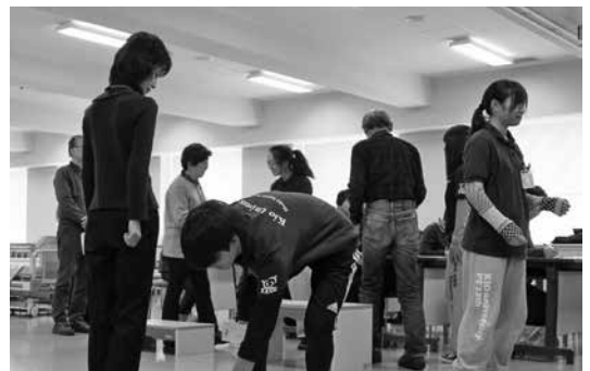
▲ロコモ度チェック！