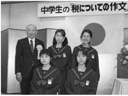
▲受賞おめでとうございます!