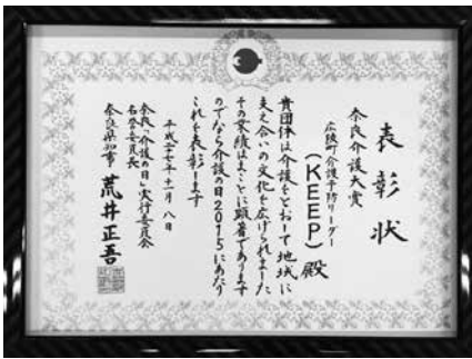
▲受賞おめでとうございます

地域社会における支え合いの文化づくりにつながる優れた活動と認められたことは、介護予防リーダー自身の励みとなり、今後の活動意欲にもつながると思われま