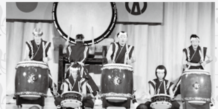
▲広陵金明太鼓の演奏