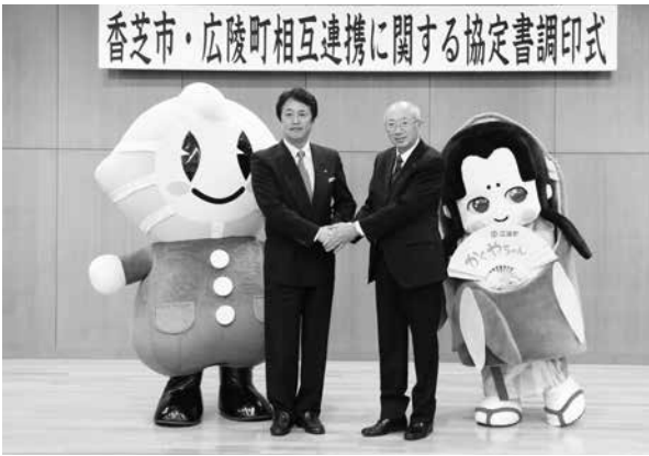
▲カッシーくん、かぐやちゃんも駆けつけてくれました

今後、香芝市と広陵町は様々な部署と調整をしながら両市町のまちづくりを進めていきます。