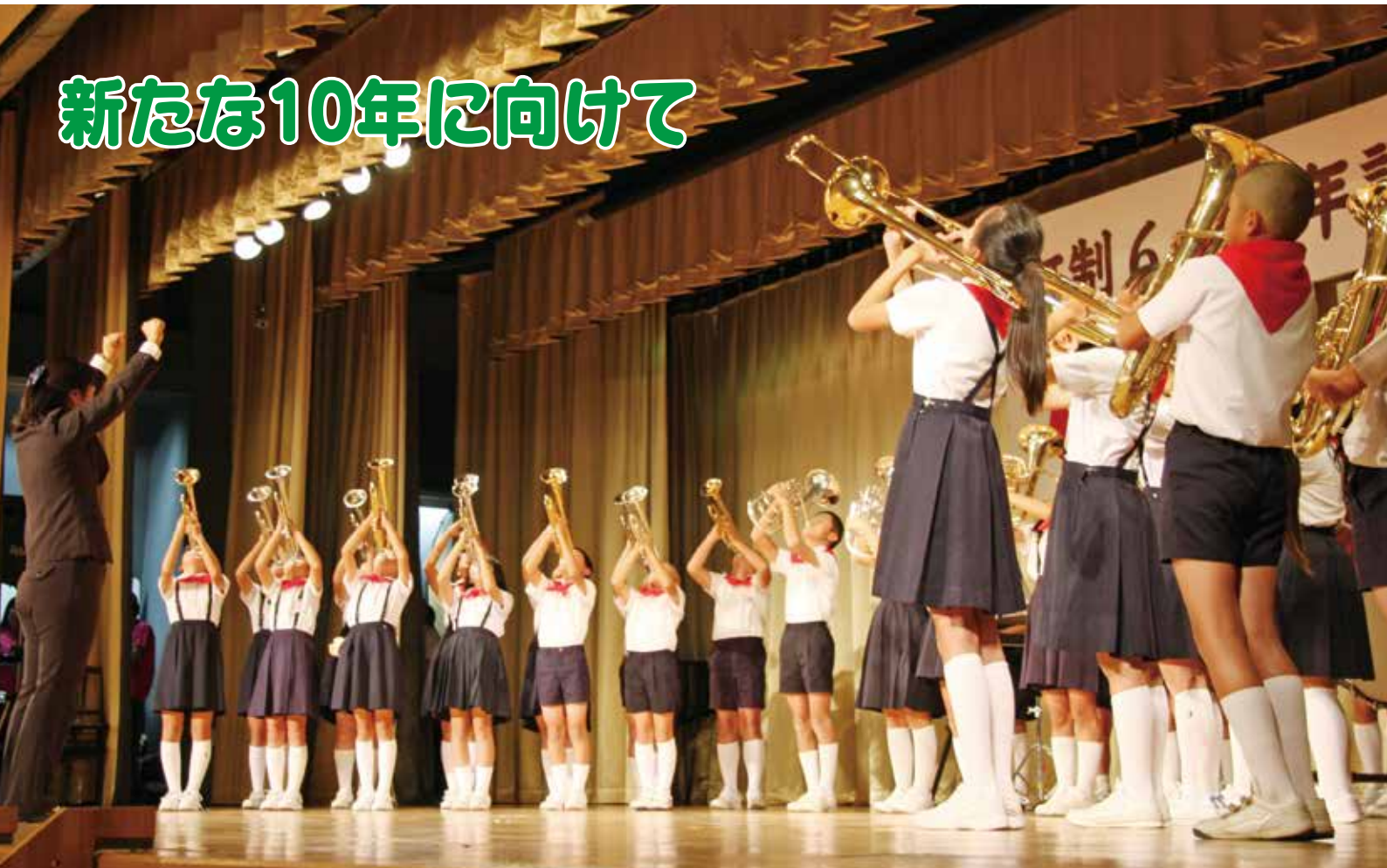
広陵東小学校金管バンド演奏（町制60周年記念式典）