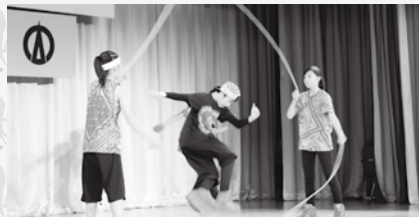
▲ダブルダッチ「ブランチ」の演技