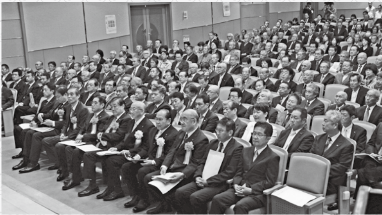
▲多くの方に出席いただきました

10月31日、広陵中央公民館かくや姫ホールで広陵町制60周年記念式典が開催されました。県内外の各首長や議会議長、町の各種団体の長など約350名が式典に参加。広陵金明太鼓の演奏とコーラス3団体による国歌・町歌斉唱で幕を開きました。第1部では、荒井県知事や奥野衆