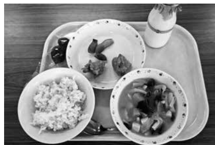
▲10月19日実施「地産地消デー」県産食材 奈良県産 ひのひかり 宇陀産 黒豆大豆えだまめ 奈良県産 米粉 奈良県産 豆腐と油揚げ

今年度、町内各小学校で、奈良 県の「学校給食地産地消促進事業」 を活用し、10月から毎月1回「地 産地消デー 奈良の日」として、 奈良県産の農林水産物・加工品を 使用した学校給食を実施していま す。また、食育として「奈良の日」 に使用された奈良県産の食材につ いての学習も行っています。