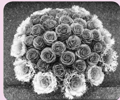
▲葉ボタン