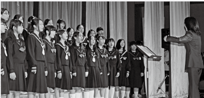
▲広陵・真美ヶ丘両中学校の合唱

れからの広陵町の未来を担う子どもたちが様々な形で元気な広陵を体現してくれました。今後とも広陵町は先人たちの想いを受け継ぎながらさらなる未来に向けて発展を続けていきます。住民の皆さんも広陵町にご協力を願います。