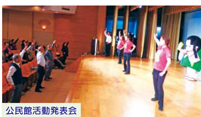
公民館活動発表会