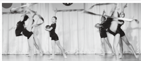
▲ミュゼ新体操クラブの演技