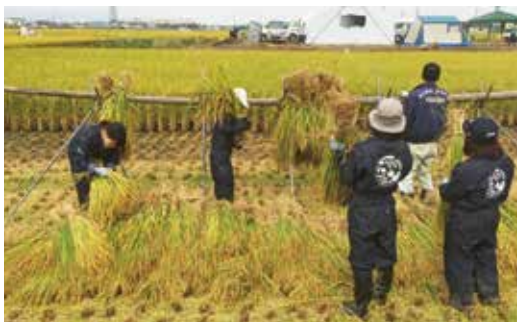
▲稲を収穫して干しています