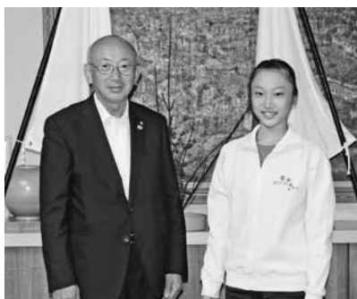
▲さらなる活躍を期待しています