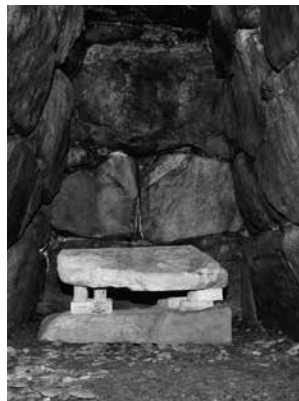
▲国指定史跡に指定されています