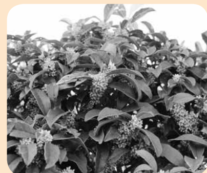
▲町の木：モクセイの花が一斉に咲きました！（役場西側生垣）