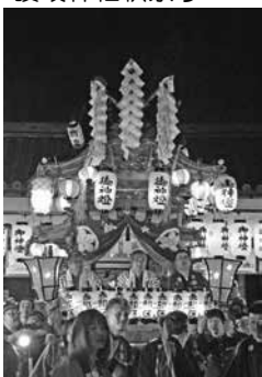
▲赤部区のだんじり

こんには。秋になって気候が良くなる、どこかへ出かけたいくなる。秋はイベントが多い！今年もかぐや姫まつり、町民体育祭、馬見フラワーフェスタなど町を代表するイベントが満載。他にも大字や自治会のイベントが盛りだくさんでした。そうなる、と広報担当の出番で、あつちやこつちやいろいろなところに顔を少し出しました。 そりや休日出勤が多いし、夜に出向くこともあるからなかなか忙しいのですが、広報担当にしか撮れない写真を撮る狙うために普段入れないような場所に入ったり、表情を撮ったりすることができるとは広報冥利とも言えますね。なにもない夜は、古本屋でマンガの立ち読み。何も考えずにマンガの世界に入り込むのもいいものです。 そうして秋の夜長を有意義に過ごしているつもりでいた。🍁でした。