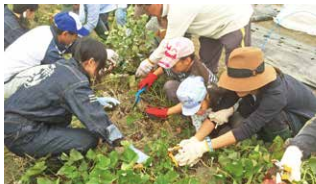
▲一生懸命土を掘り起こして…

また、下記のとおり健楽農業に参加される方を募集しています。ぜひ、ご応募ください。