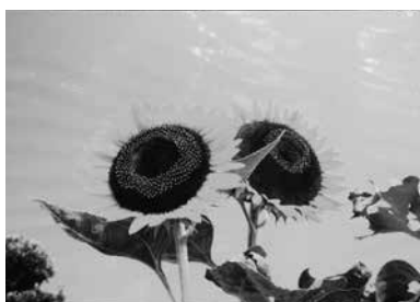
▲杉本さんの作品「太陽サンサン」