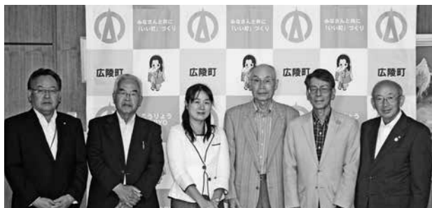
▲受賞おめでとうございます！ （右から2人目から4人目の方が受賞者です）