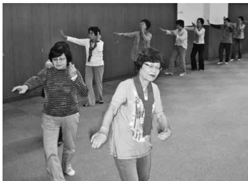
▲皆さん並んで踊りの練習