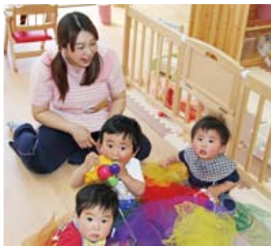
▲おもちゃも楽しいね☆

これから園児たちは、新しいひだまり保育園とともにどんどん大きく元気に成長するでしょうね。