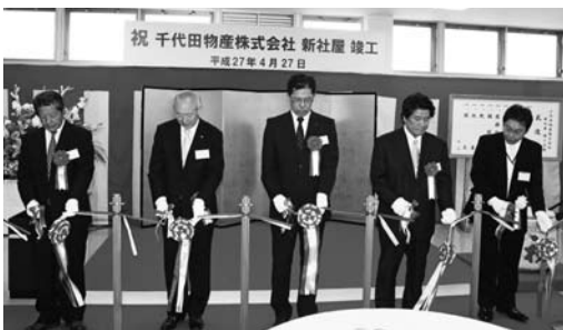
▲竣工式典には、町長をはじめ町の代表者が出席しました。

この「企業立地促進条例」は、工場などの新設や増設などに5,000万円以上投資した企業などが対象で、固定資産税の課税免除をしたり、新たに町民を雇用した場合、最大一人につき20万円を助成をしたりするなど、その他各種奨励金を交付するものです。