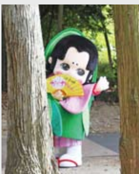
▲もしかしたら、かぐやちゃんが?!