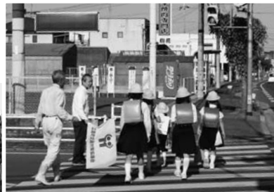
▲横断歩道でも曲がってくる車などに、気をつけて渡ろうね