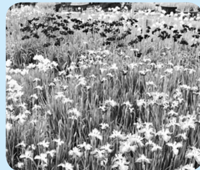
▲馬見丘陵公園の菖蒲