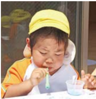
▲シャボン玉で絵を描こう!