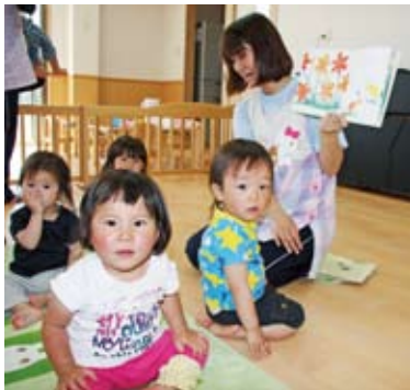
▲耳は絵本、目はカメラ?!