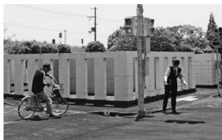
▲広陵交通公園で、高齢者のための自転車安全運転講習会が開催されました。