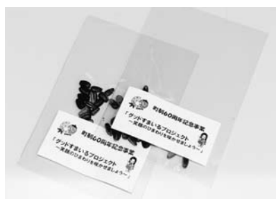
▲6月中旬に植え、町内一斉開花を目指しましょう!