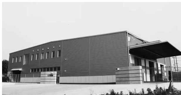
▲千代田物産株式会社の外観

この度、4月27日に企業立地促進条例第1号の届け出をした千代田物産株式会社(プラスチック製造業)が、竣工式典を行い、本町への本社移転(大字沢地内)が実現しました。