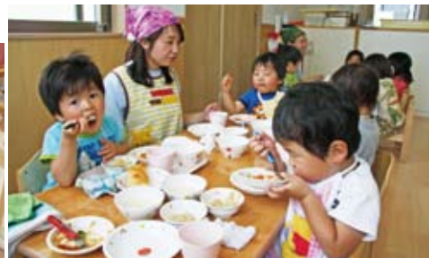
▲大好きな給食だからおいしいね!