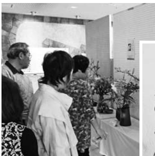
▲▶3日間だったのが、もったいないくらいの生け花でした