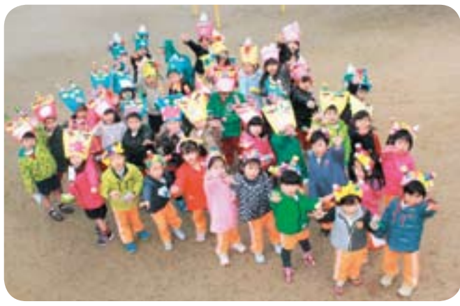
▲自分たちで作った鬼のお面をかぶって…