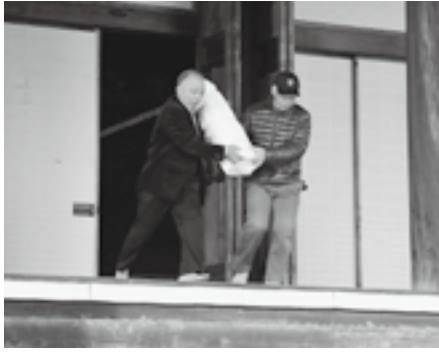
▲大切な文化財を運んでいます

1月25日、教行寺（萱野）で文化 防火訓練が行われました。 当日は、地元の方々や広陵古文化 会、広陵町消防団（第4分団・女性 消防団）、萱野自警団、北校区防災 士、広陵消防署などによる、文化財 の持ち出し訓練、消火器やバケツリ レーによる初期消火訓練、放水訓練 などが行われました。