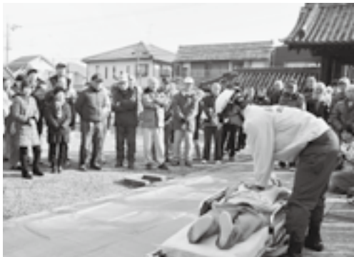
▲命を救う救命訓練！