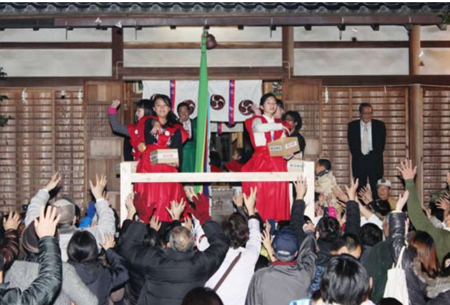
たくさんの「福」が来ますように☆ 櫛玉比女命神社