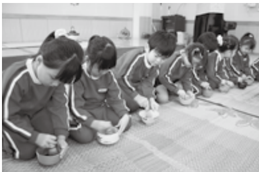
▲「シャカシャカ……」おいしくな～れ☆

また、境内では、消火器の取り扱い 訓練や天ぷら油火災の消火訓練が行わ れ、地元から多数の方が参加されまし た。「実際に消火器や濡れたタオルを 使って天ぷら油の火を消す訓練は、い ざというときに役立ちます。」と訓練 の大切さを実感されていました。 貴重な文化財を地域の皆さんで守っ てください。