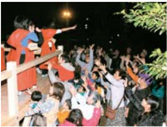
▲たくさんの方が集まり、「こっちゃんもちようだ〜い〜」と境内は大歓声

「鬼は～外、福は～内」の声とともに小さな袋詰めのだまがまかれ、境内は歓声に包まれました。