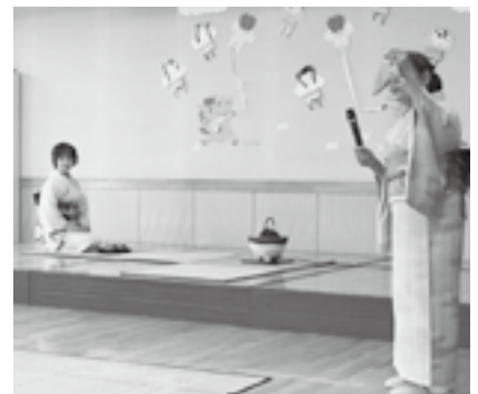
▲先生から作法について説明がありました