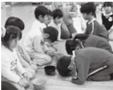
▲「召し上がれ♪」 年長組さんが運んだお抹茶です