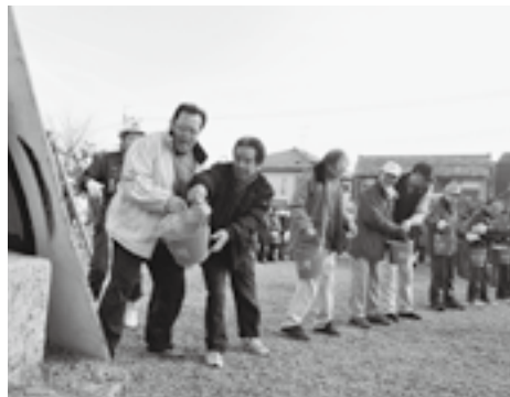
▲力を合わせてバケツリレー

また、境内では、消火器の取り扱い 訓練や天ぷら油火災の消火訓練が行わ れ、地元から多数の方が参加されまし た。「実際に消火器や濡れたタオルを 使って天ぷら油の火を消す訓練は、い ざというときに役立ちます。」と訓練 の大切さを実感されていました。 貴重な文化財を地域の皆さんで守っ てください。