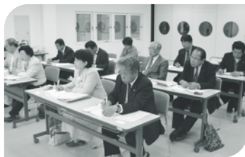
大和郡山市学校給食事務所