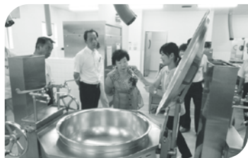
河合町立第一小学校