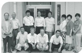
王寺町立中学校給食共同調理場

昨年12月議会において提出され、全会一致で採択された「中学校給食実施を求める請願」に基づき、広陵町議会では「中学校給食検討特別委員会」を組織し、検討しています。 給食実施の先進地事例を確認させていただくべく、河合町・王寺町・大和郡山市の給食の実態について視察研修を行いました。 今後は、いかなる方式の給食実施が広陵町に最もふさわしいかを協議、決定し、早急の実施するよう町に求めてまいります。