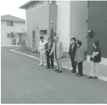
現地調査のようす