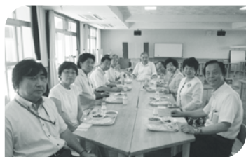
広陵町立広陵東小学校