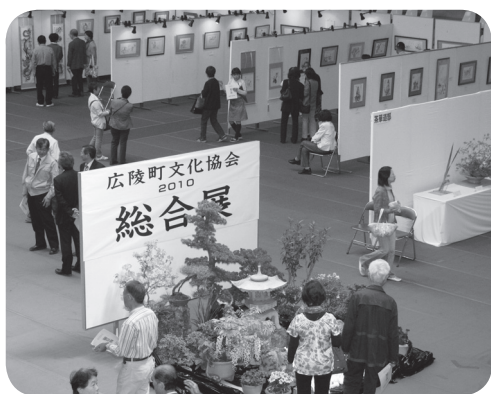
▲多くの方が熱心に作品を鑑賞していました

また、茶道の特設会場では野点が行われ、開催期間中は、町内外からたくさんの方の来場があり、それぞれの作品をひとつひとつ熱心に鑑賞されました。